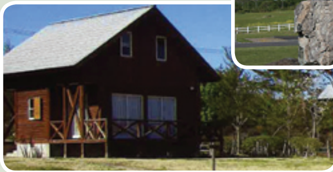
← ↑ 宿泊するコテージと、お部屋の様子。